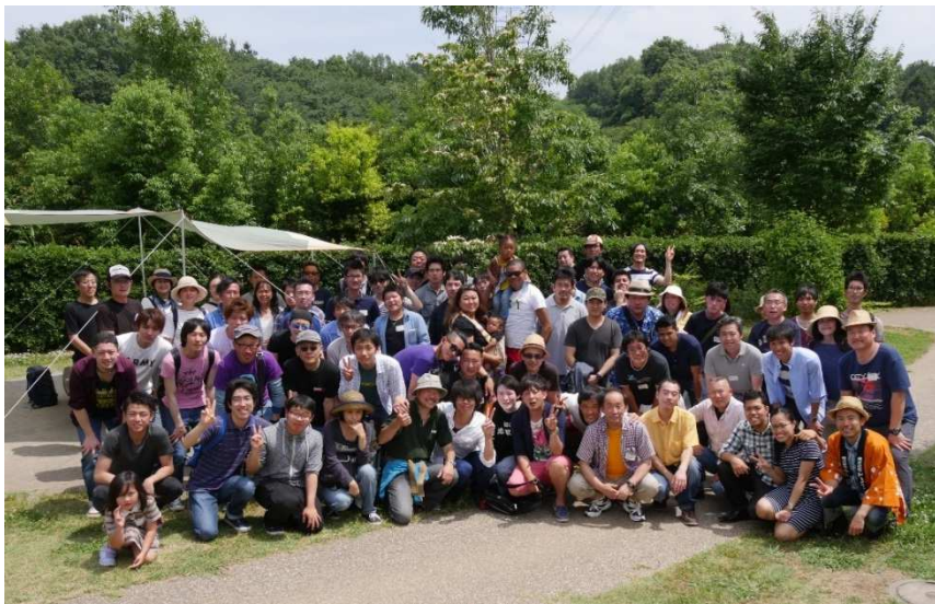
最後は、参加者全員で集合写真