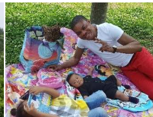
お子さんも一緒に参加してくれました！