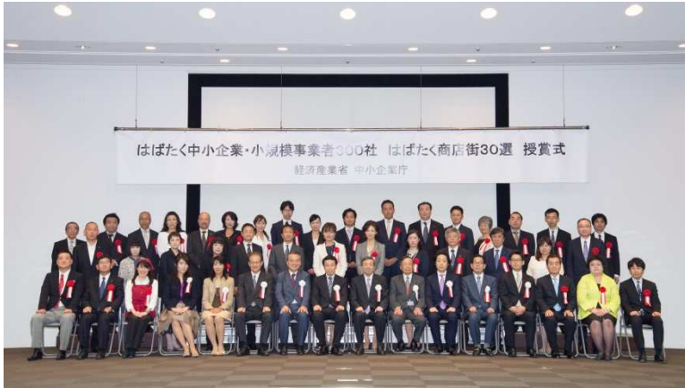
はばたく中小企業・小規模事業者300社 はばたく商店街30選 授賞式 経済産業省 中小企業庁