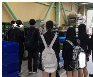
2回目の貫禄！？増田さん→