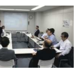
12月に第2期メンバーによる一回目のPJTが開催されました

営業ツールとして作成したパンフレットは、すでに新規顧客の営業に活用され、受注まで漕ぎ越えることが出来ました。それなりの実績成果も得られているものであると感じます。ただ、問い合わせ件数が増えたか？という点、そうでもないですし、大きな差別化が行えているか？という点、そうでもありません。 第二期においては、第一期で行った活動をよりグレードアップさせていくことを中心にサービスの差別化やNO.1化をどのように構築し表現していくのか？という点を実践していきたいと思えます。