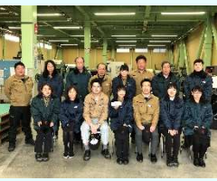
横濱金沢事業所の皆さんと