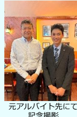
元アルバイト先にて記念撮影

プレゼンテーションが終わると、昼食と反省会のため、かつてアルバイトをしていたレストランを訪れることにしました。そこに到着すると、以前一緒に働いていた人々から暖かく歓迎されました。彼らは私を覚えており、共有した思い出に私を馳せてくれました。この出張は、過去とのつながりを築くだけでなく、自己の成長を見る機会となりました。」 (川崎・トウ)