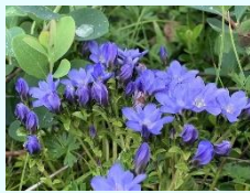
『高原のりんどう』 櫻井誠健 (本社)