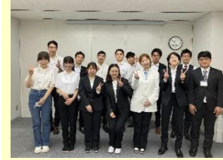
参加者で記念撮影