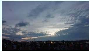
『ロックフェスでの朝陽』 小黒遊馬 (総サボ)