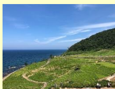
『白米千枚田』 高橋望 (本社)