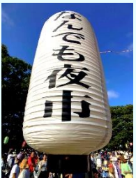
『楽しかった今無き 茅ヶ崎の夜涼』 大島健二 (幸浦)