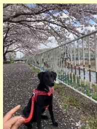
『愛川町 散歩』 江川和典 (中津)