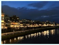
『夏夜のにぎわい』 櫻井瑞恒 (本社)