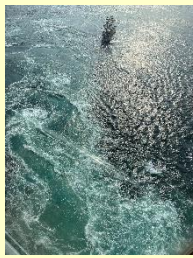
『あっ！あぶないー！』 高橋望 (本社)