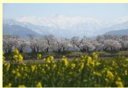
『あさひ川より』 菊田翼 (東扇島)

ト ー コ ト コ 第 9 1 号 『 夏 の 日 の 思 い 出 』 写 真 展