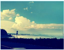
『135号からの夏の空』 菊田翼 (東扇島)