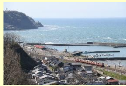
『海の見える丘より』 菊田翼 (東扇島)