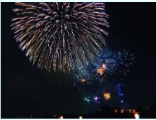
『ハナビ』 ダオホアンランアイン (習志野)