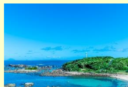
『爪木崎の眺望』 善平アントニオ (藤沢)