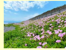
『初夏の参着』 大島健二 (幸浦)