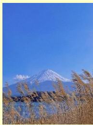
『富士山』 ダオホアンランアイン (習志野)