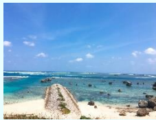
『宮古島』 竹内一磨 (習志野)