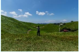
『伊豆大室山』 善平アントニオ (藤沢)