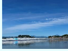
『朝の散歩とサーフィン』 櫻井瑞恒 (本社)