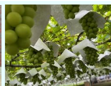
『収穫前！』 江川和典 (中津)