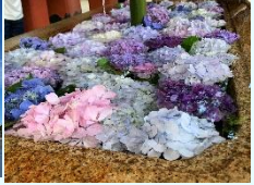
『浮き浮き紫陽花』 櫻井瑞恒 (本社)