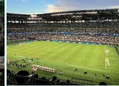
『試合前のワクワク』 櫻井武海 (総サポ)