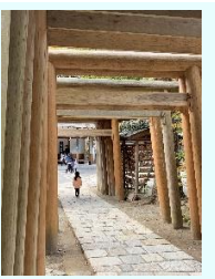
『梓梓線新井弁天』 櫻井瑞恒 (本社)

★次回写真展テーマは「動物」です。十月二十七日（金）まで募集しています。皆様のご応募お待ちしております。