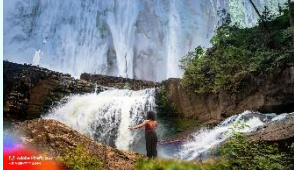
『生成AIの写真』 (ワクワク、ドキドキ、風景、海、人) 高橋望 (本社)