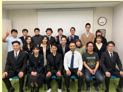
内定者を含む参加者で記念撮影

二〇二四年二月十六日（金）、本社セミナールームにて第二十三回幸せづくりサミットが開催されました。今回は経営理念でもある「幸せづくり」のための各事業所の取り組みを発表していただきました。今年は基本対面の開催となりました。各事業所の発表テーマはこちらです。