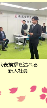
代表挨拶を述べる新入社員

新入社員全員、社会人一年目で右も左もわからない未熟者でございませう。これから何かとご面倒をおかけするところが多々あると思いますが、若さとチャレンジ精神で全力でぶつかっていきたいと思っておりますので、先輩方におかれましては、どうか、厳しいながらも温かいご指導をよろしくお願ひ申し上げます。