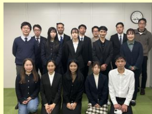
先輩社員を含む参加者で記念撮影

横浜金沢事業所展示会出席 二〇二四年二月七日（水）から三日間、パシフィコ横浜で開催された「テクノカルシヨウヨコハマ二〇二四」に出展して参りました。今年度の出展企業数は八〇七社。三日間で一八一七六名の参加者が来場し、活気にあふれた大変盛況な展示会となりました。 ブースでは入社一年目社員を含む若手社員がメインでアテンド。一般の来場者をはじめ、他の出展企業様と情報交換や名刺交換など、コミュニケーションを取ることができました。 成果としては、三日間でブースに来場された方が約一九〇名。見積依頼に繋がるご縁も複数あり、大変素晴らしい展示会となりました。