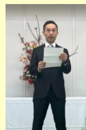
祝辞を述べる代表取締役

皆さん、こんにちは！ はじめに、トコトンに新しい仲間が加わることを心から歓迎します。皆さんのフレッシュな想いや行動が、会社をより元気にしてくれることでしょう。 皆さん、こんにちは！ はじめに、トコトンに新しい仲間が加わることを心から歓迎します。皆さんのフレッシュな想いや行動が、会社をより元気にしてくれることでしょう。