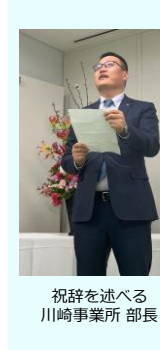
祝辞を述べる川崎事業所 部長

最後に、入社おめでとうございませう。皆さんの新たなキャリアが素晴らしいものとなることを心から願っています。ありがとうございます。